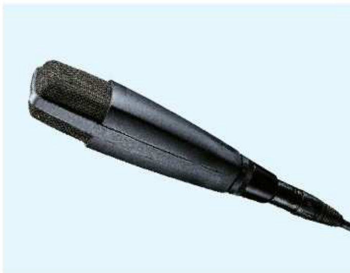
Kabel przedstawiony na ilustracji nie wchodzi w skład standardowego wyposażenia.

MD 421 II należy do najbardziej znanym mikrofonów na świecie. Dzięki swoim walorom akustycznym z powodzeniem może być stosowany w niezmiernie wielu instalacjach akustycznych o różnym charakterze. 5-pozycyjny przełącznik korekcji niskich częstotliwości. Dostępny w kolorze czarnym.